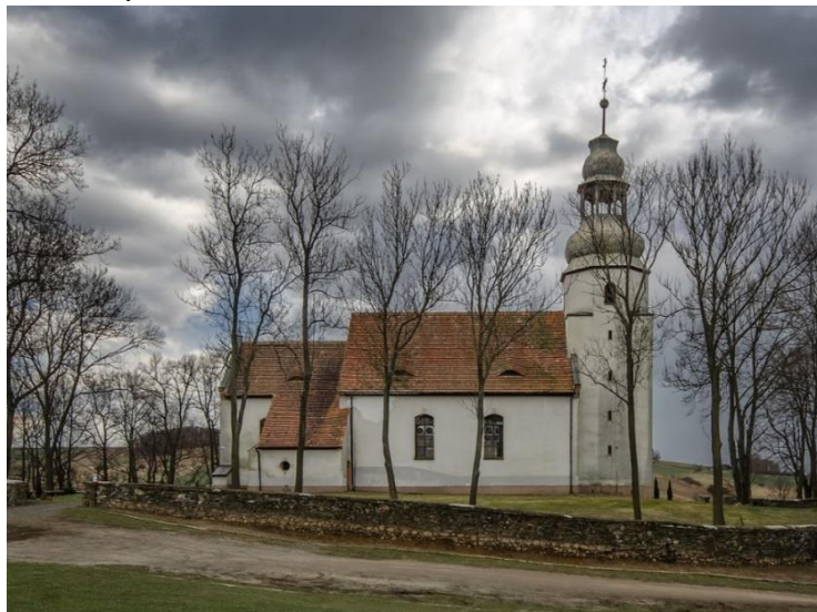
Fot. 7.3.7: Kościół pw. św. Marcina w Pomocnem