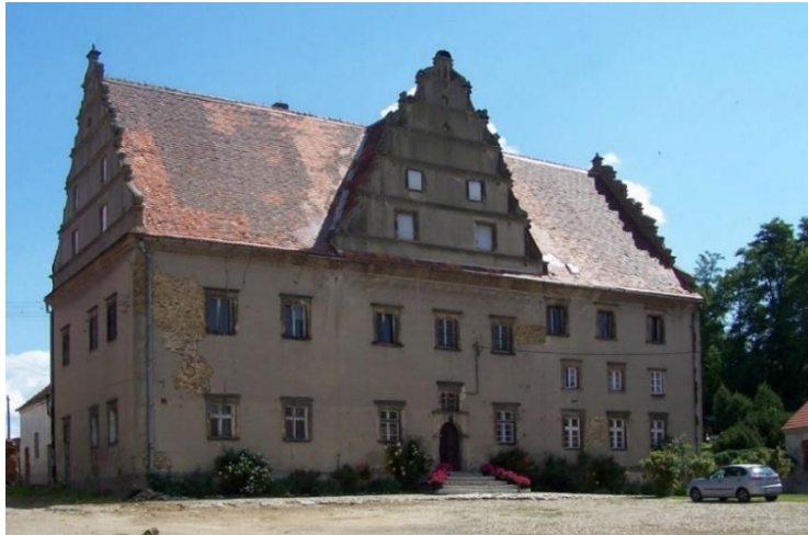
Fot. 7.6.4: Dwór w Pawłowicach Wielkich