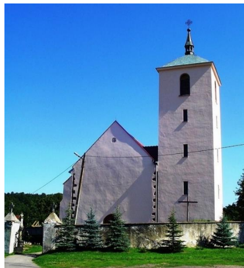
Fot. 7.2.8: Kościół Najświętszej Marii Panny w Sadach Górnych