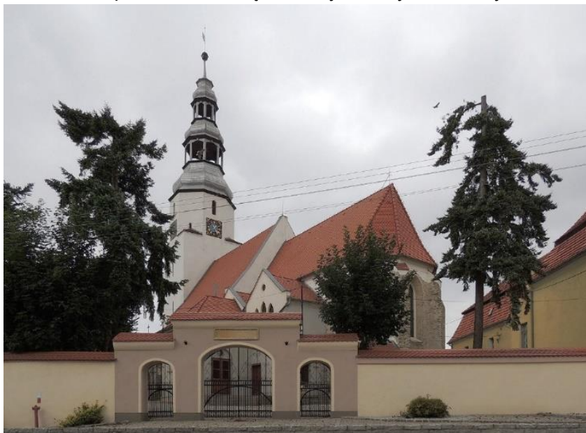
Fot. 7.6.2: Kościół pw. Wniebowzięcia Maryi Panny w Mierczycach