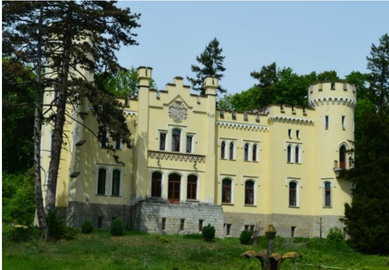
Fot. 7.5.4: Pałac w Myśliborzu