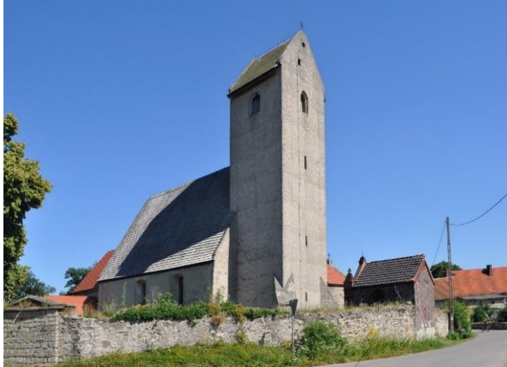
Fot. 7.5.6: Kościół pw. Podwyższenia Krzyża Świętego w Wiadrowie