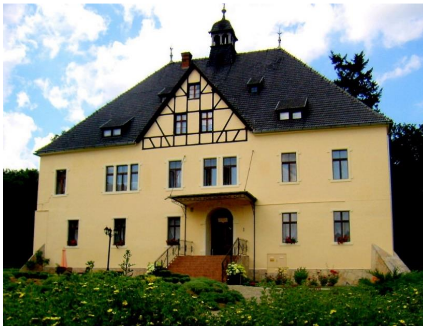
Fot. 7.5.2: Pałac w Grobli