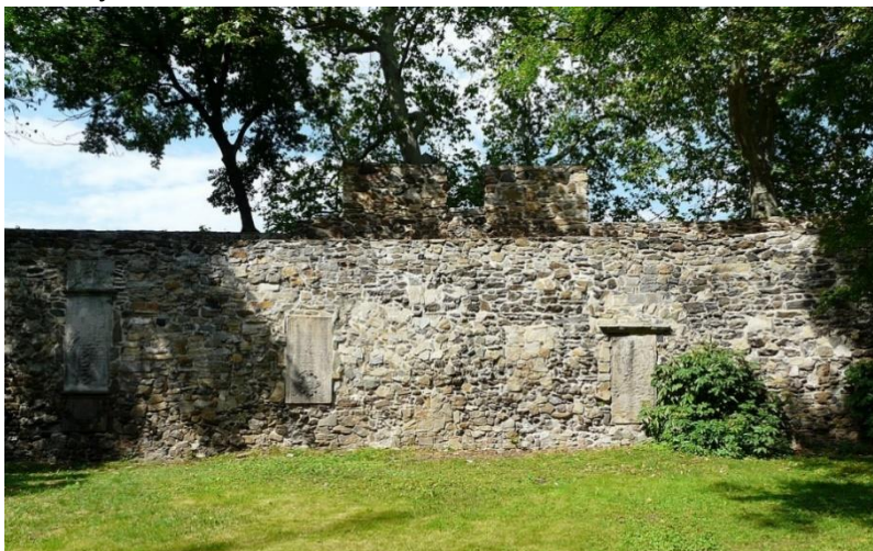
Fot. 7.1.7: Mury obronne