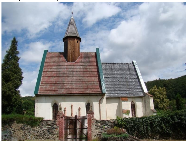
Fot. 7.5.1: Kościół pw. św. Anny w Grobli