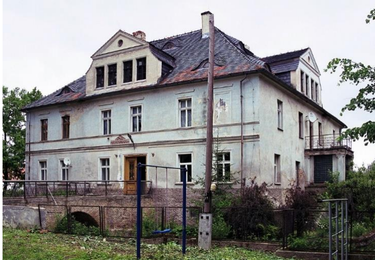
Fot. 7.5.7: Pałac w Wiadrowie