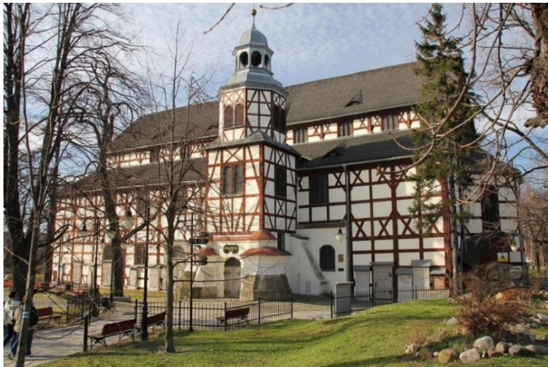
Fot. 7.1.3: Ewangelicki Kościół Pokoju pw. Ducha Świętego w Jaworze