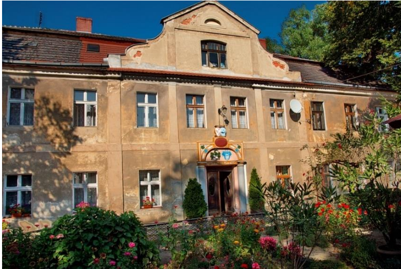
Fot. 7.4.5: Dwór w Drzymałowicach