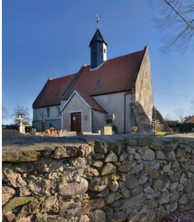
Fot. 7.5.10: Kościół Wniebowzięcia Najświętszej Marii Panny w Nowej Wsi Wielkiej