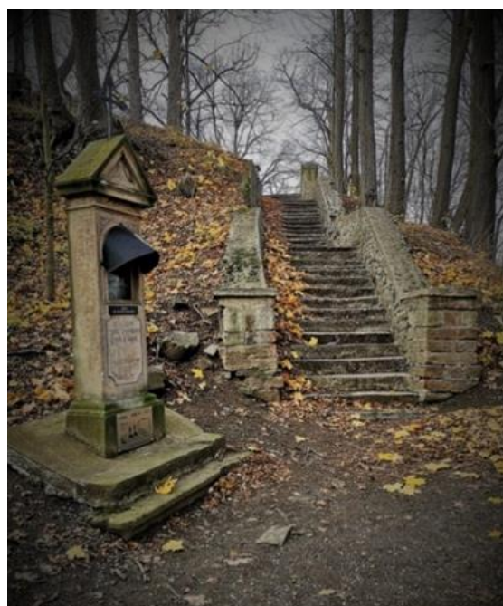
Fot. 7.3.1: Kalwaria na Górzec