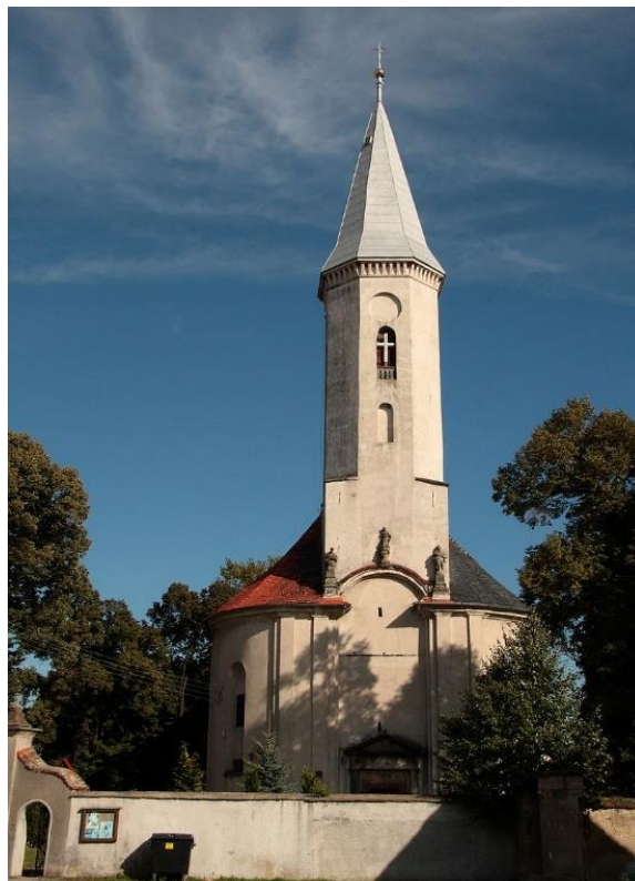
Fot. 7.4.1: Kościół pw. Nawiedzenia Najświętszej Marii Panny w Mściwojowie