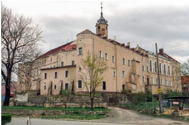
Fot. 7.1.5: Zamek Piastowski w Jaworze