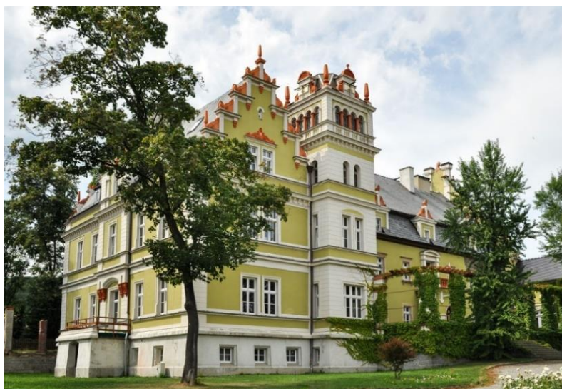
Fot. 7.5.5: Pałac w Kłonicach