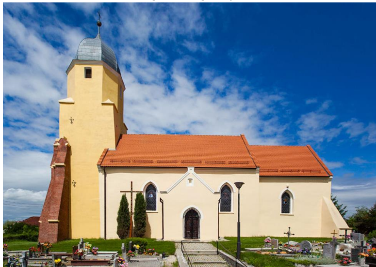
Fot. 7.4.6: Kościół pw. św. Jadwigi w Targoszynie