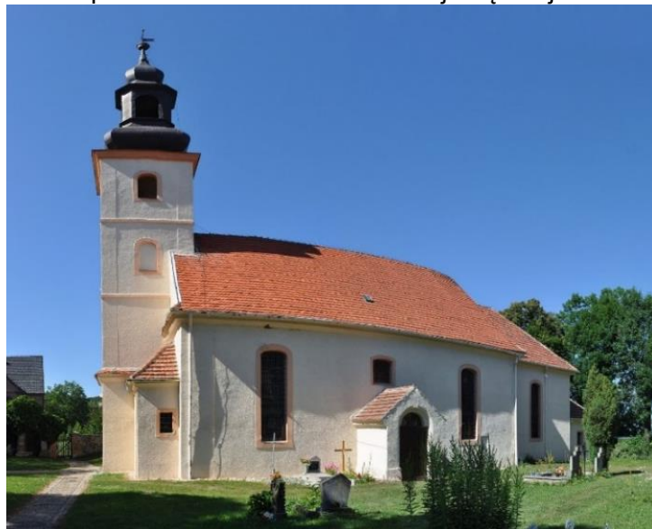
Fot. 7.5.9: Kościół pw. św. Józefa Oblubieńca Najświętszej Marii Panny w Kwietnikach