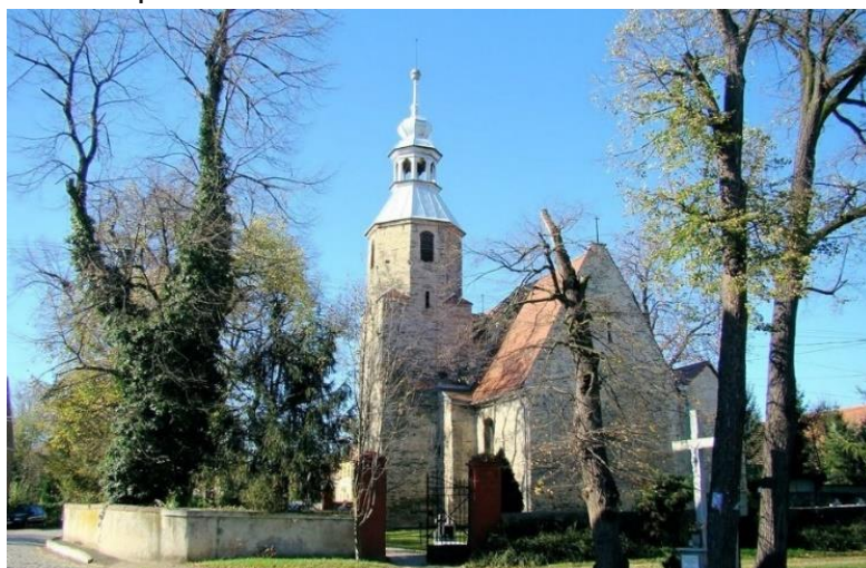
Fot. 7.6.7: Kościół pw. Serca Pana Jezusa w Granowicach