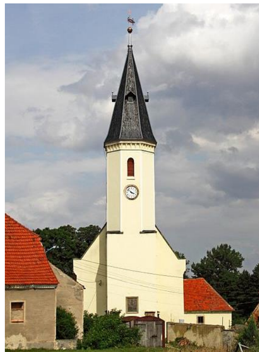
Fot. 7.4.4: Kościół pw. Zaślubin Najświętszej Marii Panny w Luboradzu