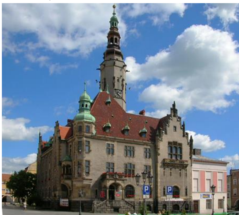
Fot. 7.1.2: Ratusz w Jaworze