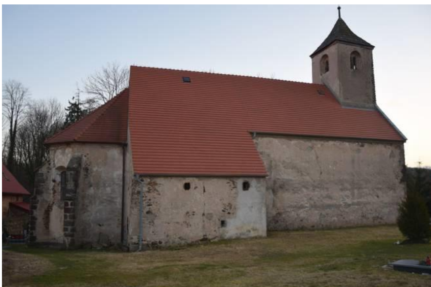
Fot. 7.5.3: Kościół pw. Podwyższenia Krzyża Świętego w Pogwizdowie

Źródło: Karkonosze GO; Kościół pw. Podwyższenia Krzyża Świętego w Pogwizdowie; https://karkonosze.go.pl/artyku/osiem-wiekow-historii-n1284685 [dostęp: 06.11.2024 r.]