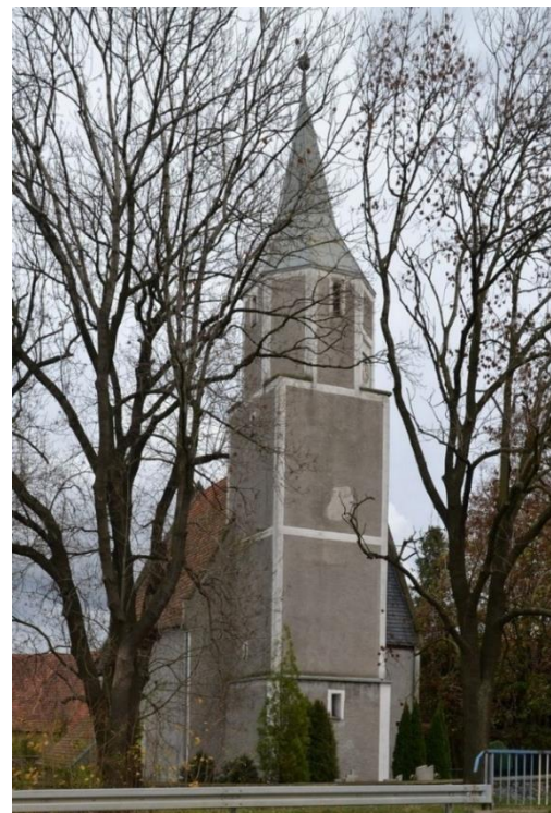
Fot. 7.3.5: Kościół pw. św. Jana Chrzciciela