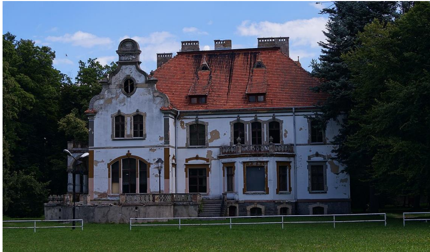
Fot. 7.4.7: Pałac w Targoszynie