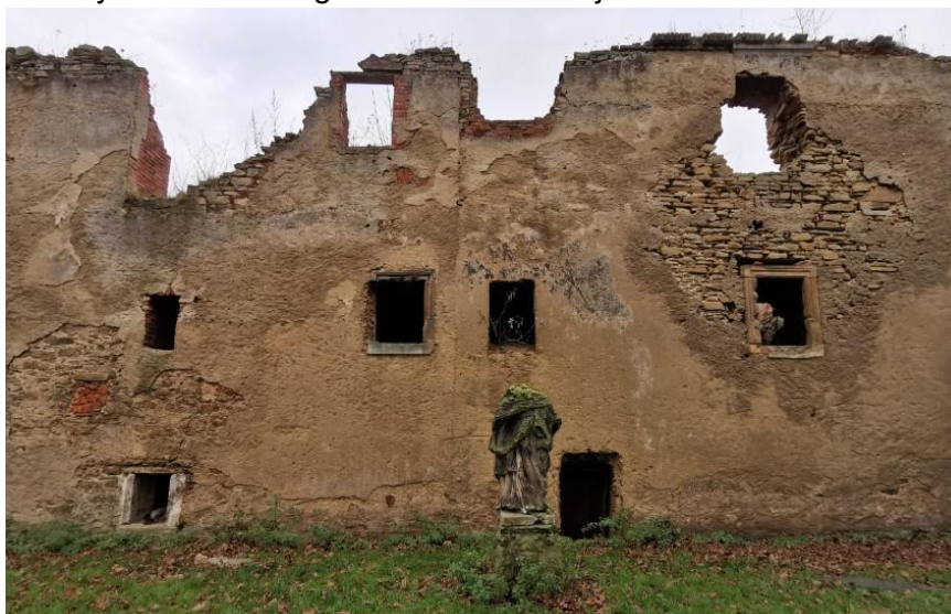
Fot. 7.4.2: Ruiny renesansowego dworu w Mściwojowie