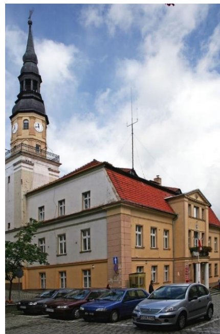
Fot. 7.2.2: Ratusz w Bolkowie