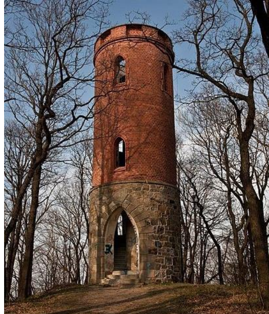
Fot. 7.5.8: Wieża widokowa na wzgórzu Radogost