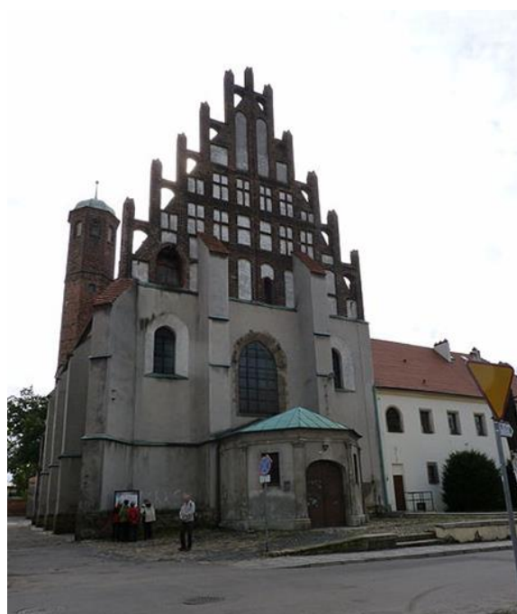
Fot. 7.1.8: Klasztor oo. bernardynów