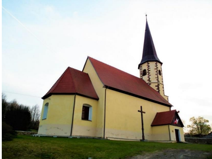
Fot. 7.3.6: Kościół pw. św. Jerzego w Kondratowie