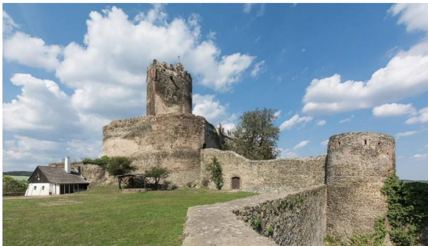
Fot. 7.2.1: Zamek Bolków