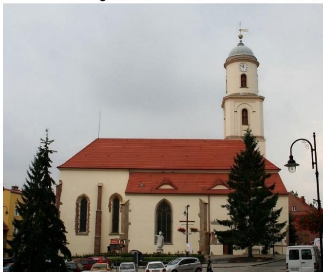
Fot. 7.2.4: Kościół św. Jadwigi w Bolkow