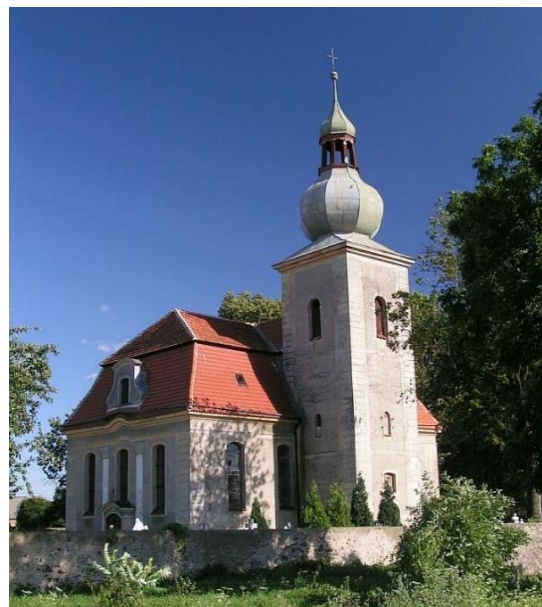
Fot. 7.6.5: Kościół pw. św. Piotra i Pawła w Kosiskach