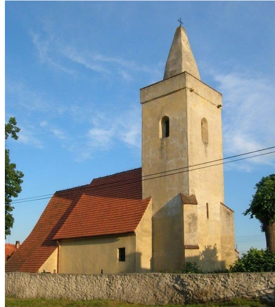
Fot. 7.6.6: Kościół pw. św. Marcina w Postolicach