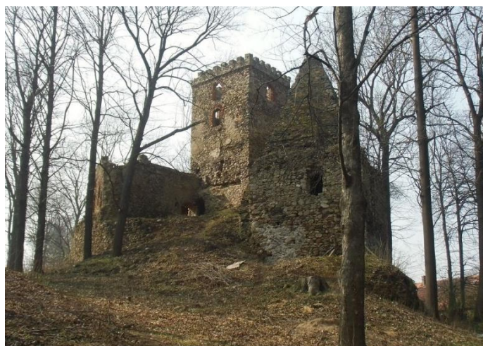
Fot. 7.2.6: Zamek w Lipie