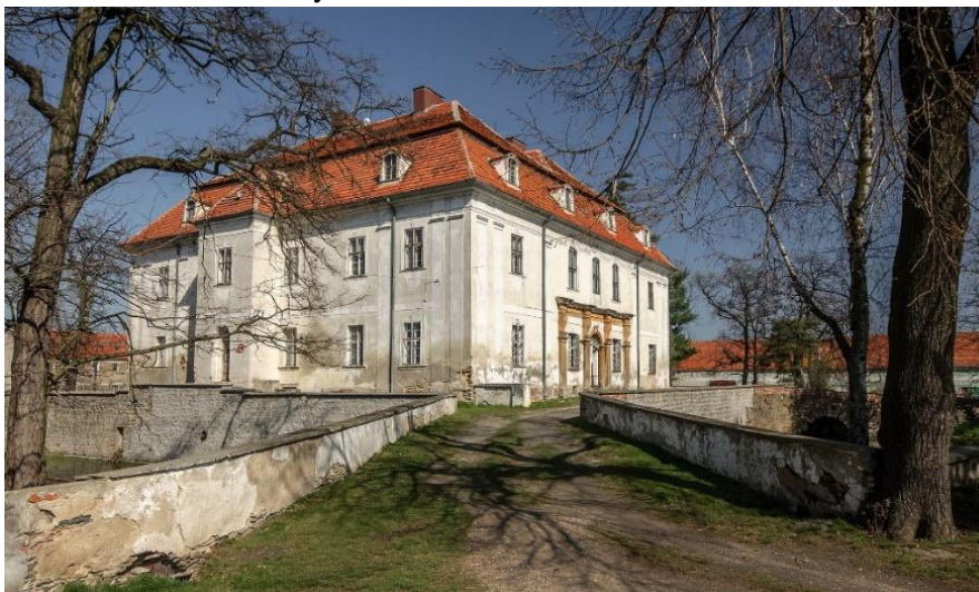
Fot. 7.6.3: Pałac w Mierczycach

Źródło: Wikipedia; Pałac w Mierczycach; https://pl.wikipedia.org/wiki/Pa%C5%82ac_w_Mierzycach [dostęp: 06.11.2024 r.]