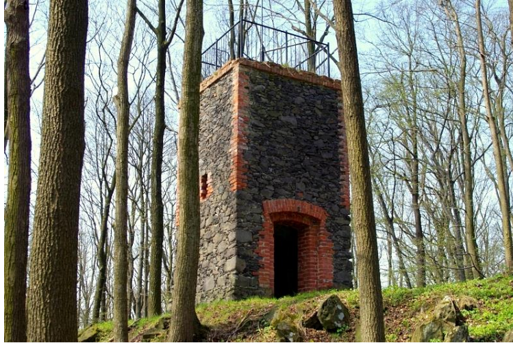
Fot. 7.3.4: Wieża widokowa na górze Mszana