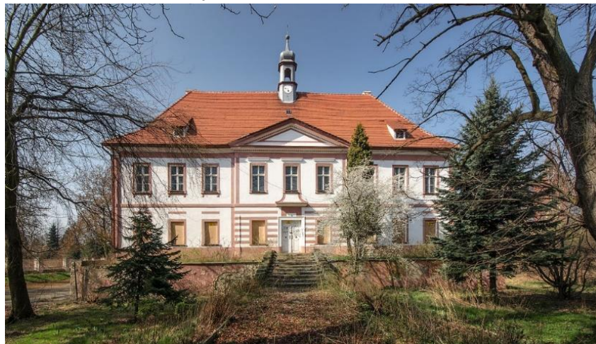
Fot. 7.4.8: Pałac w Snowidzy