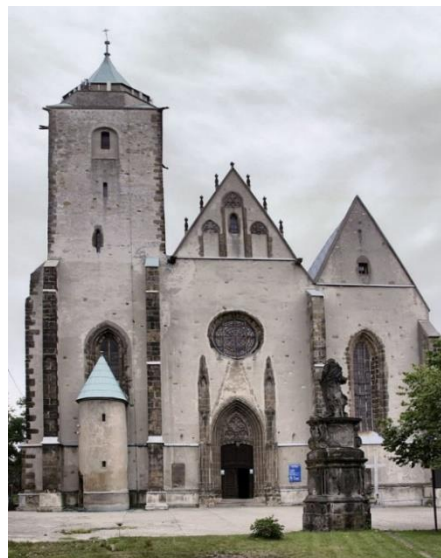
Fot. 7.1.4: Kościół św. Marcina w Jaworze