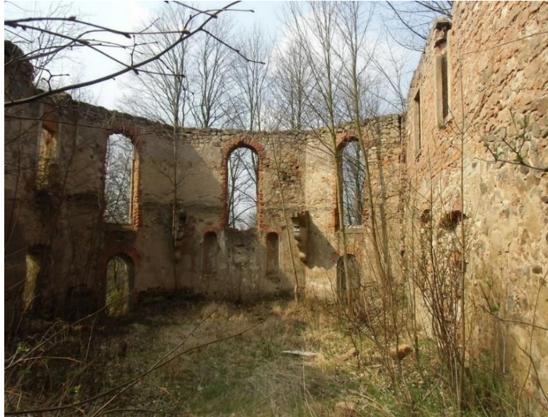
Fot. 7.3.8: Dwór w Kondratowie