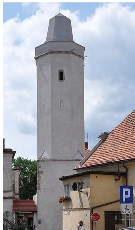
Fot. 7.1.6: Baszta Strzegomska w Jaworze