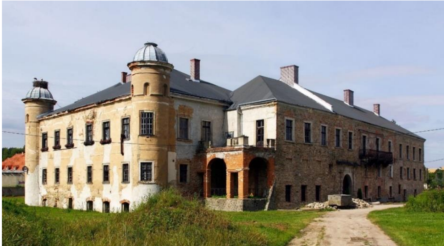
Fot. 7.4.3: Pałac w Luboradzu