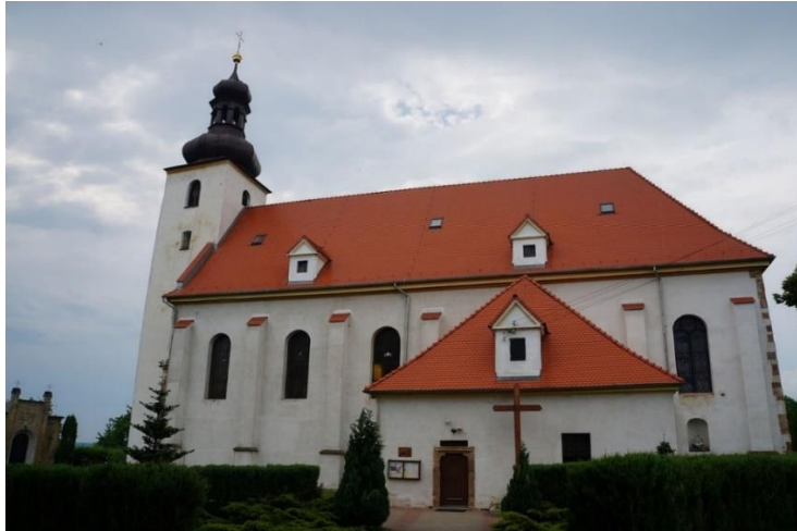
Fot. 7.3.2: Kościół Wniebowzięcia Najświętszej Marii Panny w Słupie