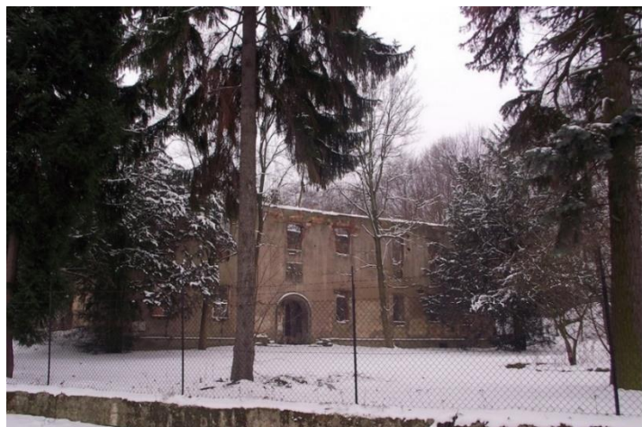
Fot. 7.3.3: Pałac w Sichowie