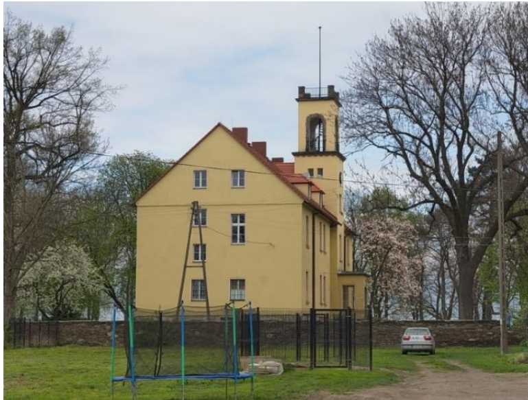
Fot. 7.6.8: Dwór w Budziszowie Małym