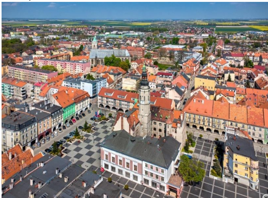
Fot. 7.1.1: Rynek w Jaworze