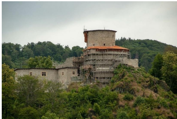
Fot. 7.2.7: Zamek Niesytno