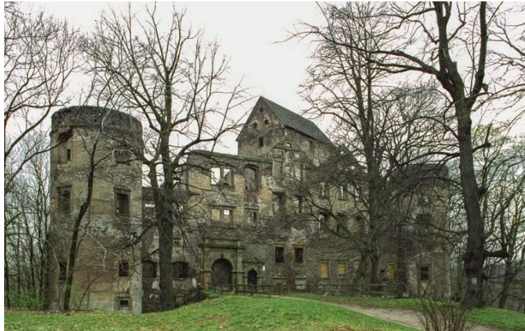
Fot. 7.2.5: Zamek Świny